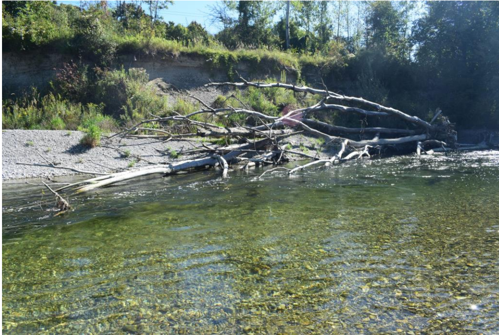
Foto 5: Das Foto zeigt einen naturnahen Uferabschnitt des Lechs mit offenem Steilufer, sich verlagerndem Kies im Flussbett und Totholz. Dieses Struktureichtum bietet neuen Lebensraum für eine Vielzahl an Tieren und Pflanzen - so könnte es an der Musterstrecke mal aussehen.

Der parallel laufende Uferweg wird hierfür zurückgebaut und ist damit nicht mehr durchgängig. Eine Umleitung ist ausgeschildert (vgl. Abb. 1).