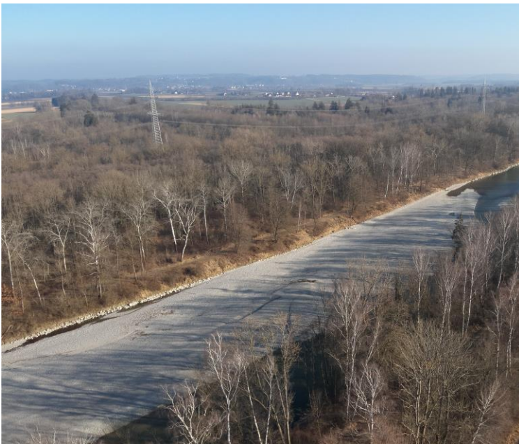
Foto 4: Blick auf das ehemalige gerade und verbaute Ufer des Lechs.

Im Oktober sorgen nun große Geräte dafür die geradlinige Uferbefestigung (vgl. Foto 4) zu lösen und strukturreich umzuformen. Der Lech darf sich hier nun eigendynamisch entwickeln und sein Ufer selbst formen (vgl. Foto 5).