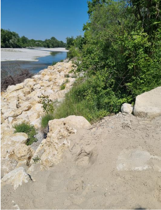
Foto 3: Zauneidechsen finden hier ein sonniges, sandiges Ersatzhabitat: Der aufgeweitete Bereich auf Höhe des Flusskilometers 33,5 wurde aufgrund ufernaher Strommasten mit Wasserbausteinen gesichert.

Im Oktober sorgen nun große Geräte dafür die geradlinige Uferbefestigung (vgl. Foto 4) zu lösen und strukturreich umzuformen. Der Lech darf sich hier nun eigendynamisch entwickeln und sein Ufer selbst formen (vgl. Foto 5).