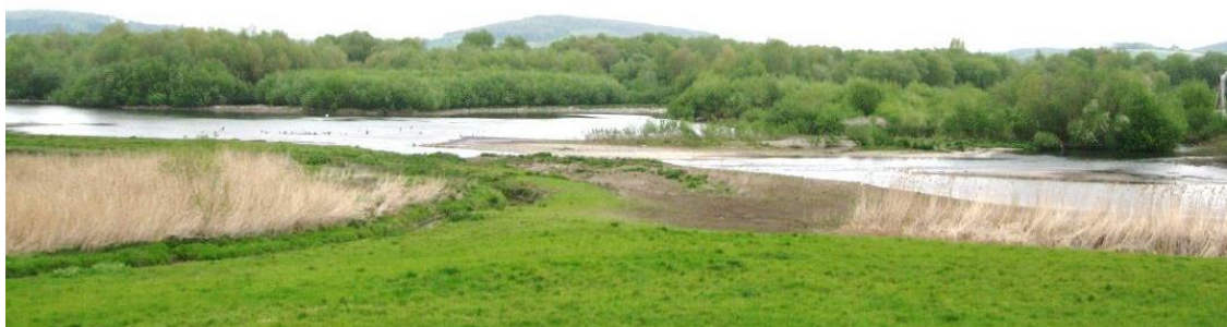
Blick auf das Vogelschutzgebiet im Hochwasserrückhaltebecken Salzderhelden

Das Hochwasserrückhaltebecken Salzderhelden liegt in Niedersachsen am Fluss Leine, besteht aus mehreren Teilpoldern und umfasst insgesamt rund 37 Mio. m 3 . Die Flächen werden heute vielfältig genutzt: im Standort befinden sich zum Beispiel viele landwirtschaftliche Flächen, ein großes Naturschutzgebiet und ein Kiesabbau-gebiet.